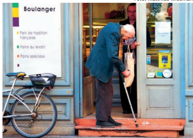
Was nützen ihm Supermarkt und Vertragslandwirtschaft?

Landwirtschaft und Versorgung kümmern wollen. Das fördert gegenseitiges Verständnis. Einerseits. Aber erneut entwickelt sich ein unvollständiges Leitbild der Versorgung, das nur Leitbild sein kann, weil es nicht die ganze Realität ins Auge fasst: Kein Konsument, keine Konsumentin kann nur mit dem in Direktvermarktung oder Direktbeschaffung verfügbaren Warenkorb auskommen. Es braucht «den Laden» weiterhin – im Bewusstsein und im Leitbild bleibt er aber verdrängt.